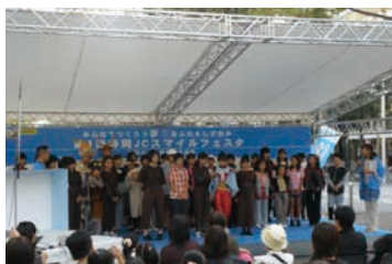
スマイルフェスタ